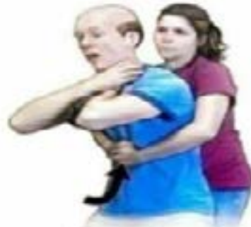
Maniobra de Heimlich en adultos.