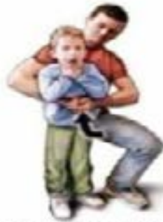
Maniobra de Heimlich en niños.