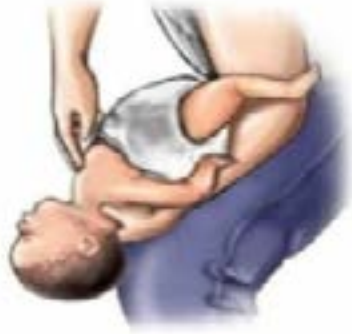
Maniobra de Heimlich en bebés (empujes en el pecho).